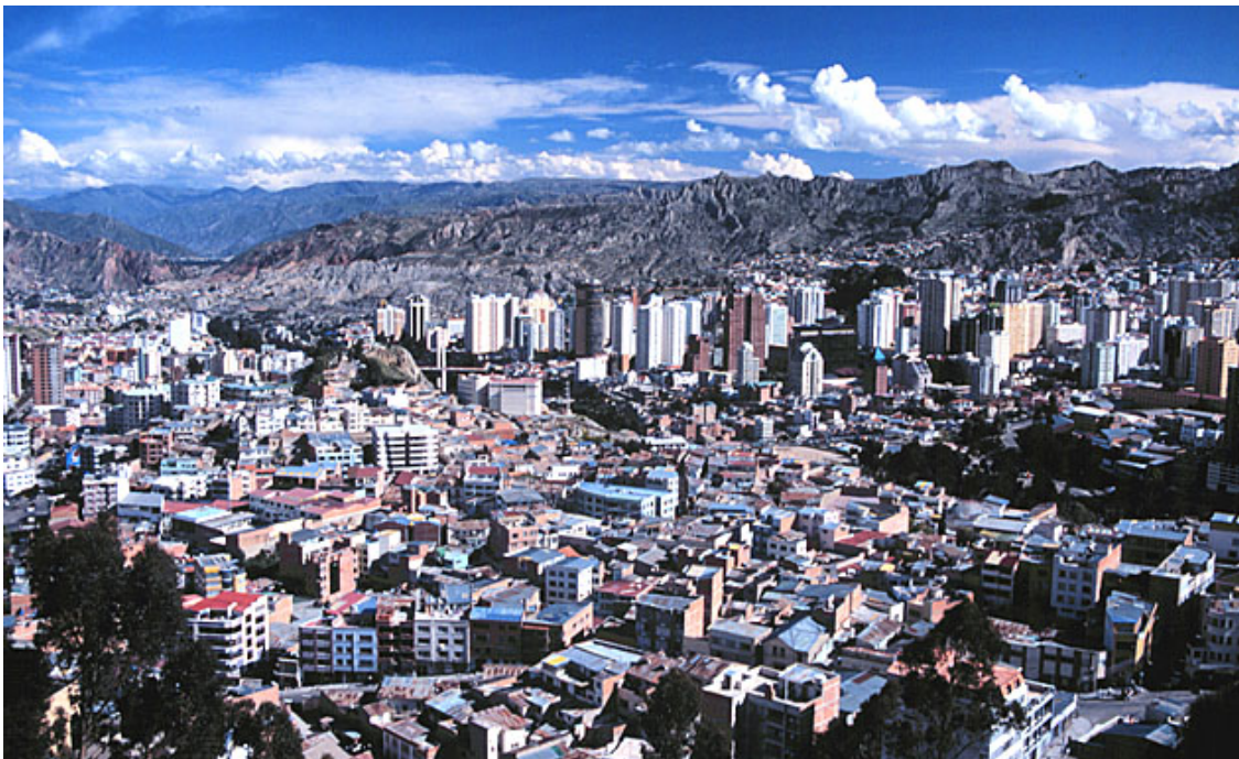
Obr.B La Paz, 2004