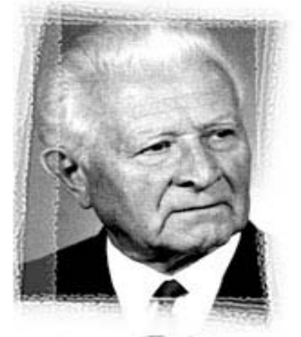
Tomáš G. Masaryk