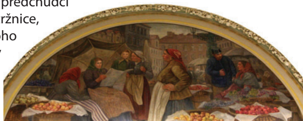
Luneta od V. Bartoňka ve Staroměstské tržnici

Na přelomu 19. a 20. století v Praze vyrostly první kamenné tržnice, předchůdci budoucích obchodních domů. První z nich byla Staroměstská tržnice, následovala Vinohradská. Důvodů pro jejich založení bylo mnoho – lepší hygienické podmínky pod střechou, možnost lepší kontroly zboží, elektrické osvětlení, dodávky pitné vody. Kromě těchto technických důvodů hrál důležitou roli fakt, že domácích výrobců potravin ubývalo a nacházeli se stále dál od Prahy, jejich roli postupně začaly přebírat potraviny a zboží vyráběné průmyslově.