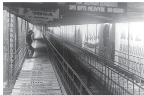
Eskalátor na Letné

První letiště bylo zprovozněno roku _____ v Kbelích.