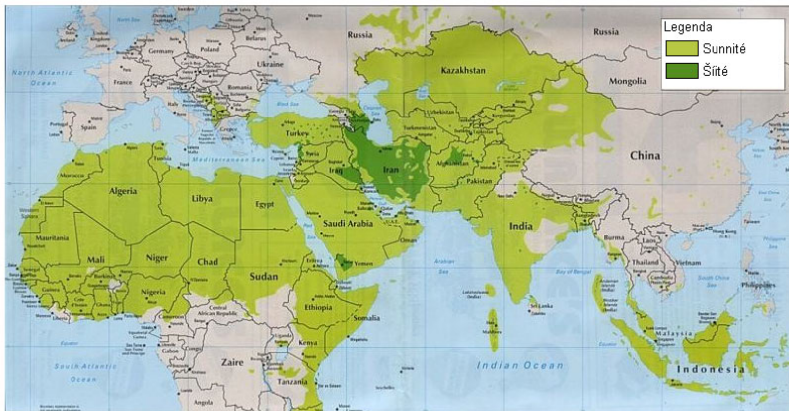
Obrázek 3: Rozmístění Sunnitů a Šitů