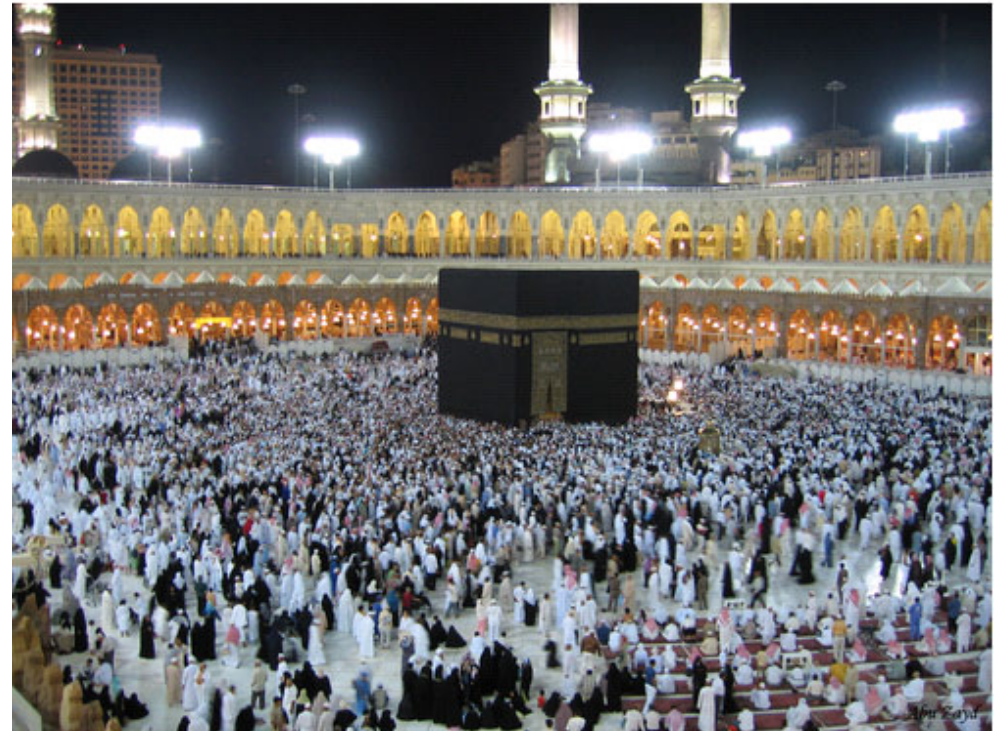
Obrázek 1: Ka'aba v Mekce