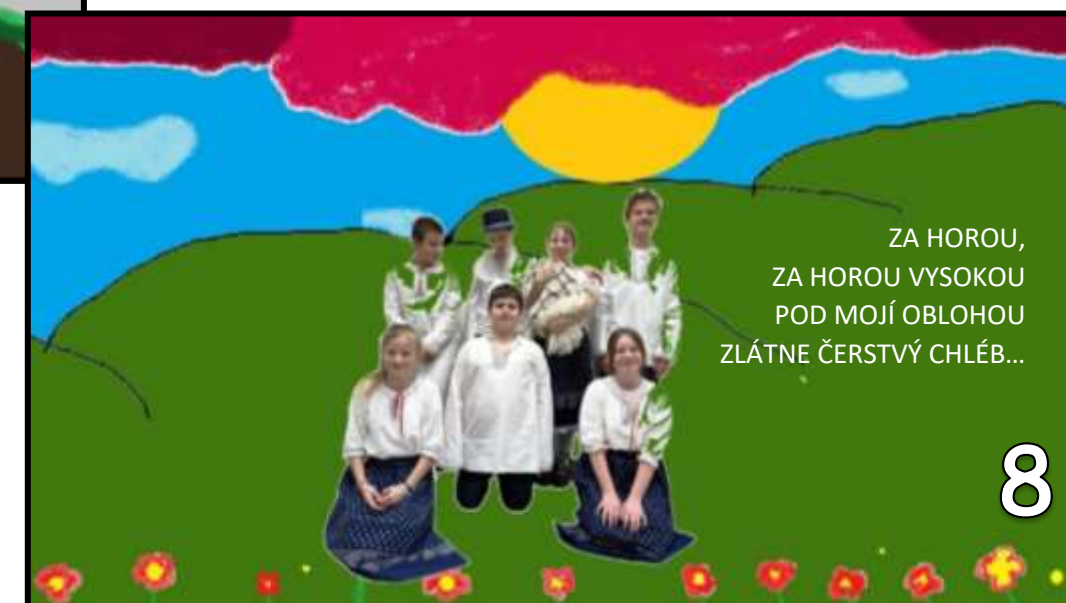
Prožili dlouhý a šťastný život a narodilo se jim osm dětí