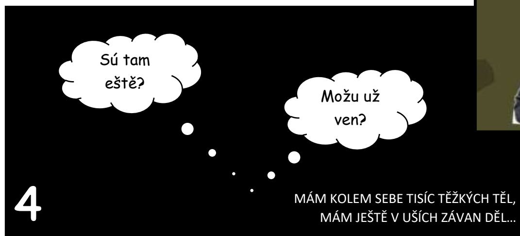
Tři dny čekal...