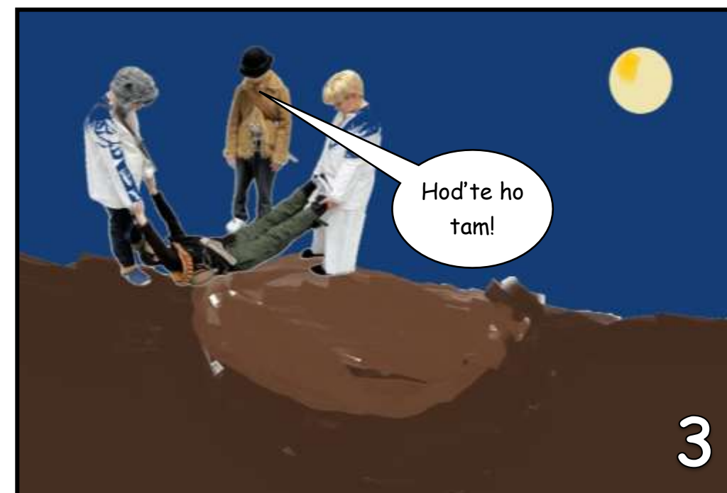
Předstíral smrt a byl vhozen do společného hrobu.