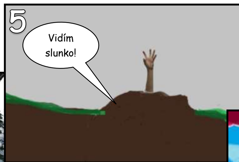
... než vylezl z hrobu.

Obrázky a fotky jsou dílem žáků 5. ročníku ZŠ a MŠ Kateřinice, okres Vsetín. © 2023