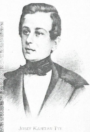
JOSEF KAJETÁN TYL