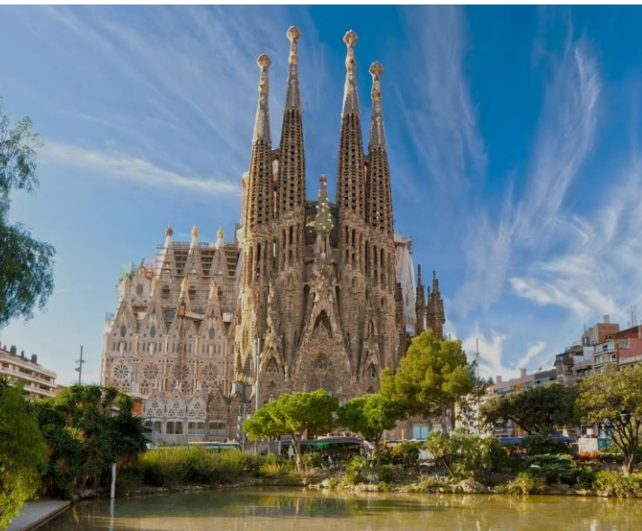
Chrám Sagrada Familia v Barceloně

Líbí se vám tyto stavby? Proč ano? Proč ne? Co je podle vás jejich účelem?