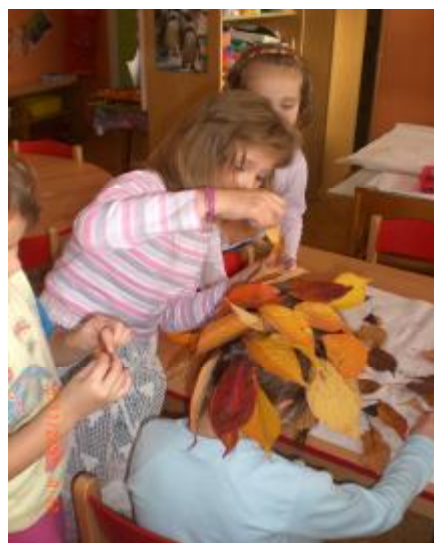
Obrázek 1a, 1b