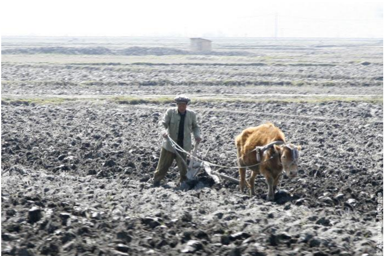
Život mimo města