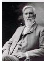
Elisha Gray (Obr.č.3)

7. března 1876 – žádost o patentování zamítnuta