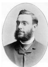
Thomas Watson (Obr.č.2)

pomocný asistent Alexandra Grahama Bella