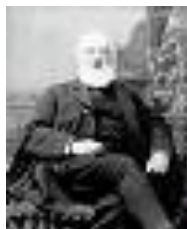
Antonio Meucci (Obr.č.4)